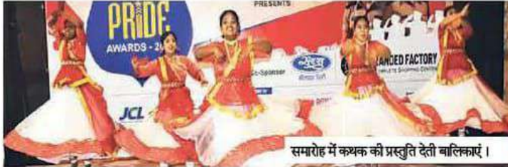
समारोह में कथक की प्रस्तुति देती बालिकाएं।